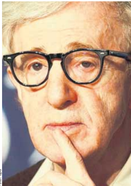
Woody Allen bei einer Pressekonferenz 2010 in Cannes.