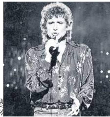
Peter Hofmann 1987 bei einem Auftritt im Berliner Palast der Republik.

Dabei debütierte er nach seinem Studium so rasch wie vielversprechend als Tamino in Mozarts „Zauberflöte“ und brillierte nur vier Jahre später als Siegmund in Wagners „Walküre“. Dies allerdings nicht in irgendeiner „Ring“-Produktion, sondern im als „Jahrhundert-Ring“ bejubelten Projekt von Patrice Chéreau bei den Bayreuther Festspielen 1976. Ausgerechnet in dieser Partie war der Schatten auf seiner Stimme knapp einhalb Jahrzehnte später dann nicht mehr zu überhören, das Publikum hat den einst so gefeierten Helden öffentlich ausgebuht. Der gestürzte Liebling, dessen Höhenflug ihn vor allem als Wagner-Tenor (Lohengrin, Tristan, Parsifal, Stolz) an die größten Häuser in aller Welt führte, sang nie wieder Oper. Schon 1990 brachte er jedoch seine Ambitionen als hühnerhafter, blondmähniger Ak-